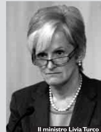
Il ministro Livia Turco